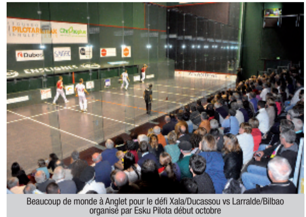
Beaucoup de monde à Anglet pour le défi Xala/Ducassou vs Larralde/Bilbao organisé par Esku Pilota début octobre

De plus en plus de partenaires rejoignent Esku Pilota: ils ont confiance dans cette association qui défend ce sport traditionnel basque et ils savent qu'Esku Pilota est formée uniquement de bénévoles qui n'ont ni intérêt personnel ni financier. Le sacre mondial de Battite Ducassou à Mexico nous a profondément réjouis, non comme un aboutissement mais plutôt comme le début d'une réussite et comme l'affirmation d'une action efficace et désintéressée au service de la main nue.